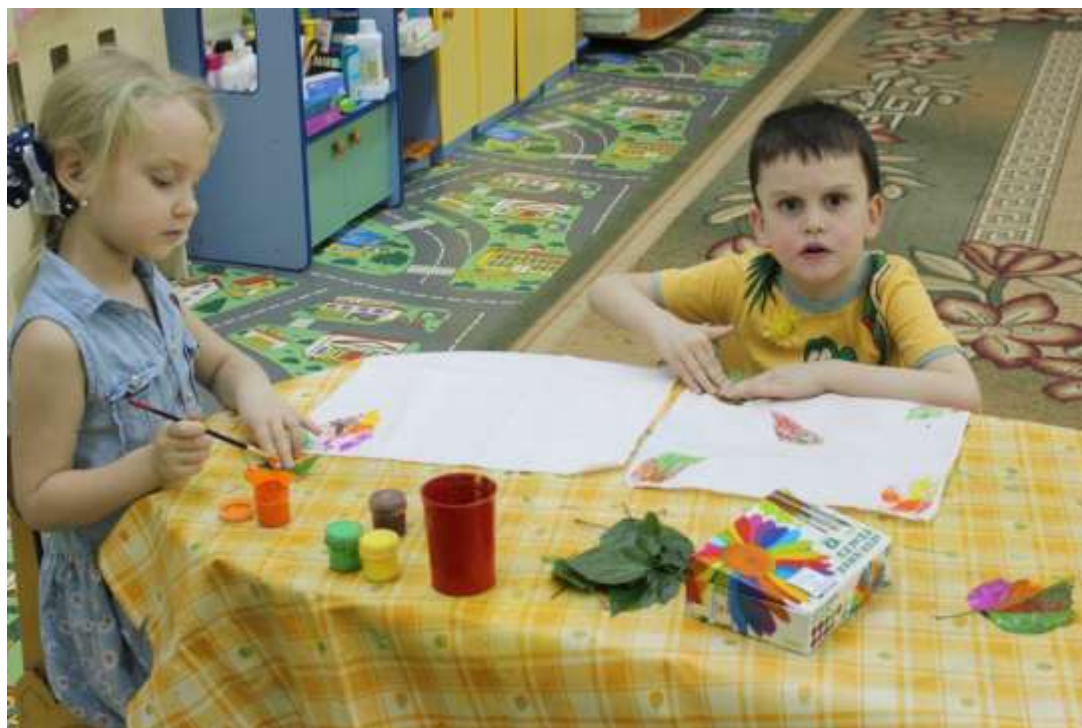
Рисование «Еловый лес»